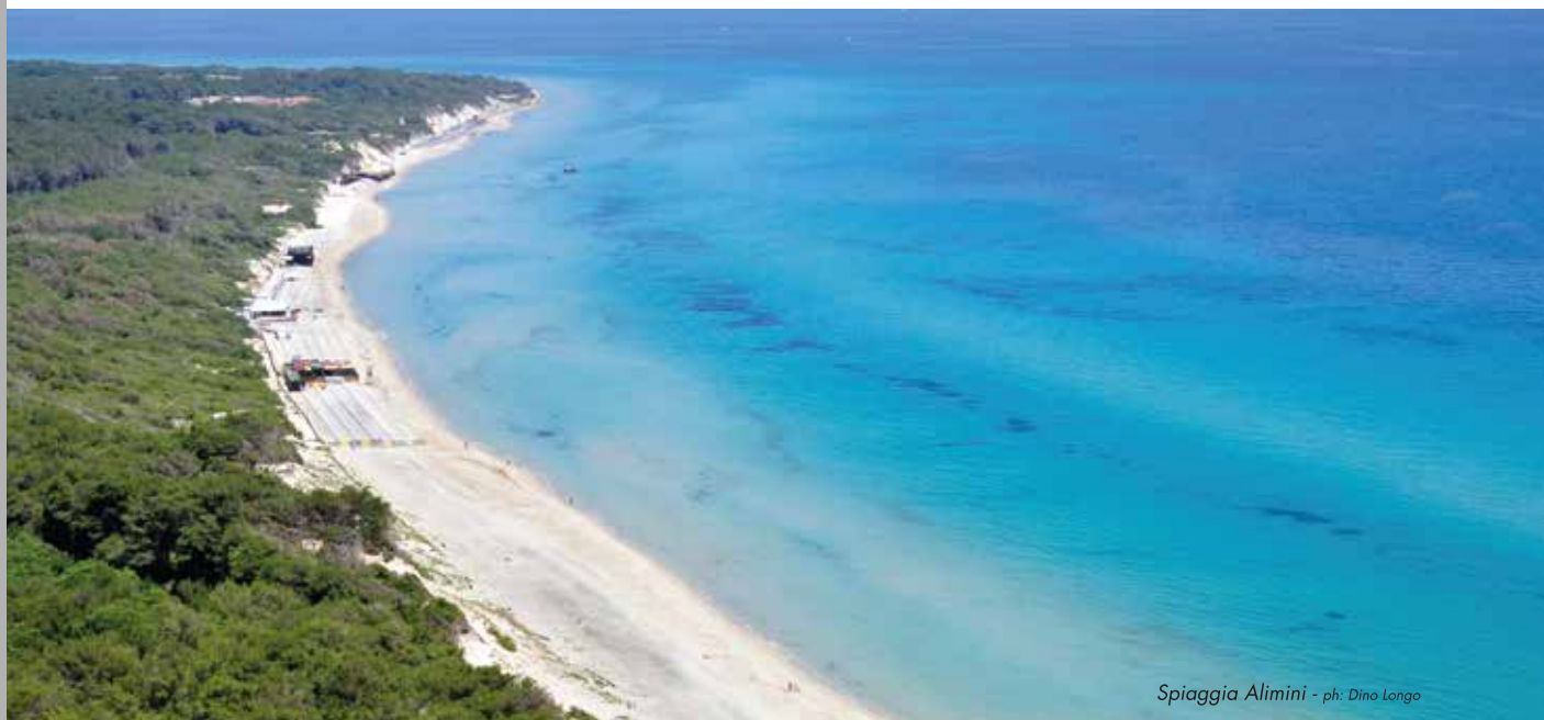
Spiaggia Alimini