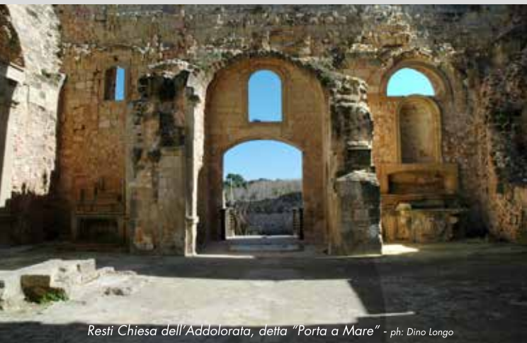
Resti Chiesa dell'Addolorata, detta "Porta a Mare"