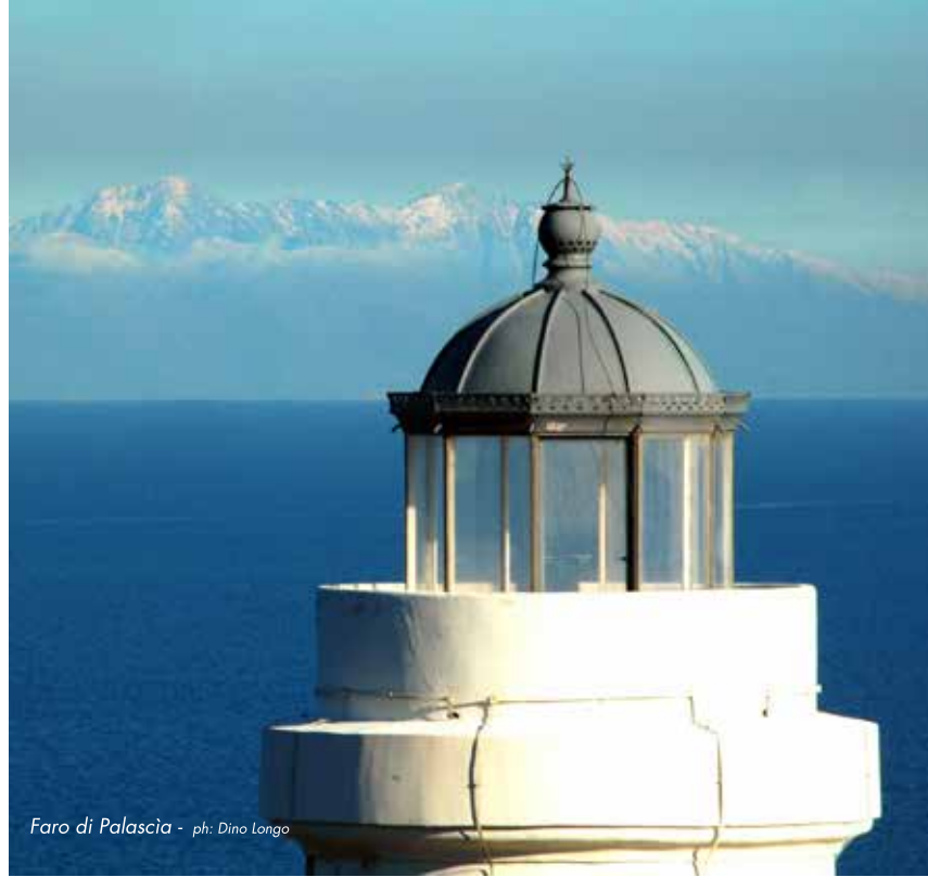
Faro di Palascia