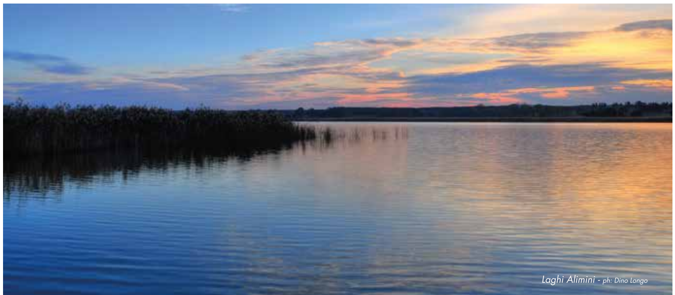
Laghi Alimini