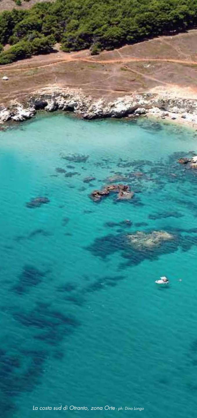
La costa sud di Otranto, zona Orte