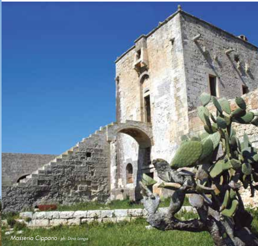
Masseria Cippano