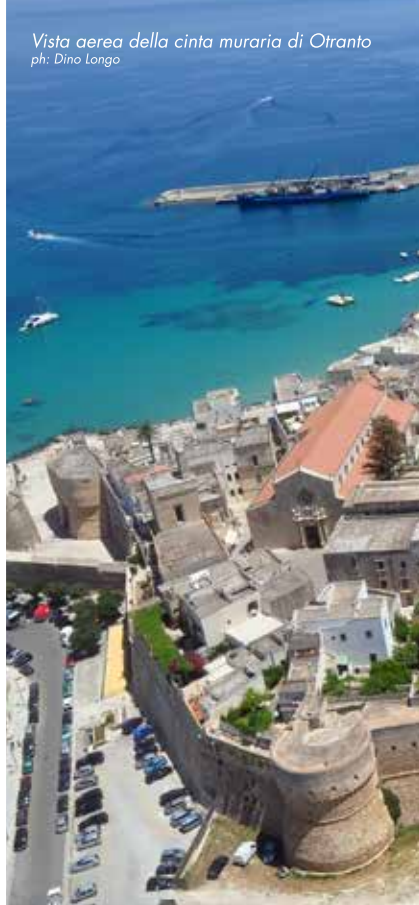
Vista aerea della cinta muraria di Otranto