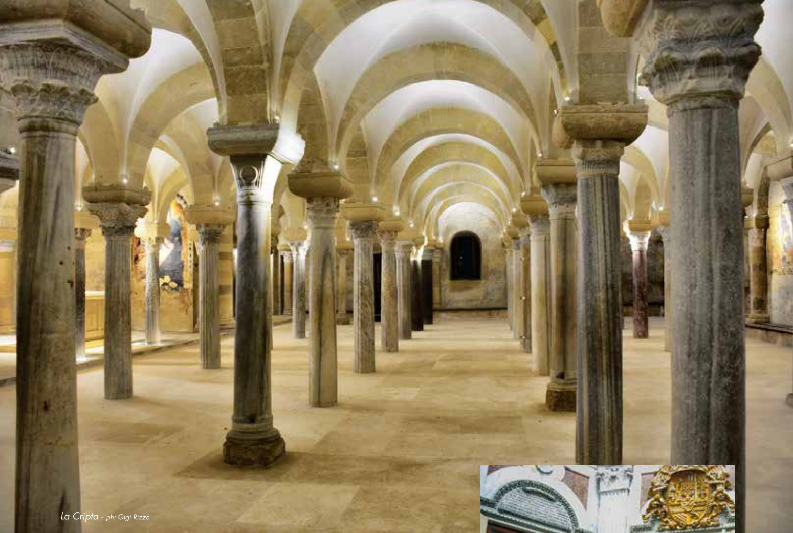
La Cripta

La Cappella dei Martiri è situata nell'abside destra. Qui si conservano le ossa dei Santi Martiri idruntini canonizzati il 12 maggio 2013. Nell'area sottostante, la cripta risalente all'XI secolo con le sue oltre 70 colonne.