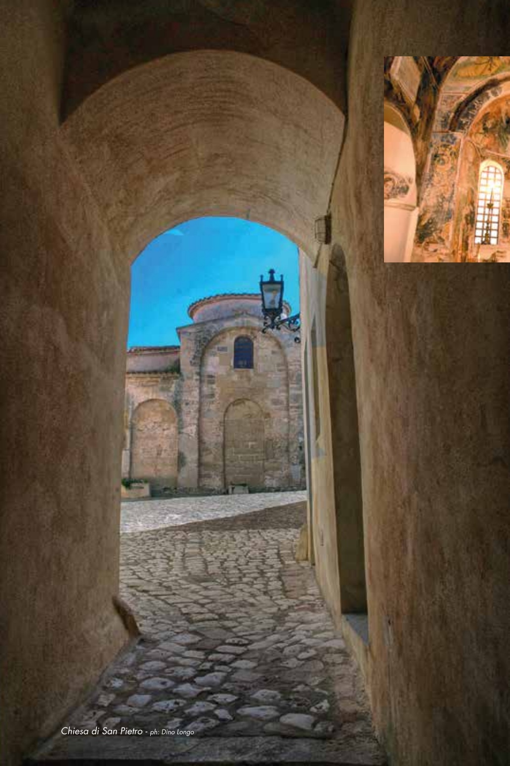
Chiesa di San Pietro