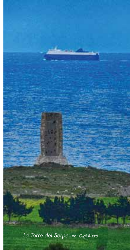
La Torre del Serpe