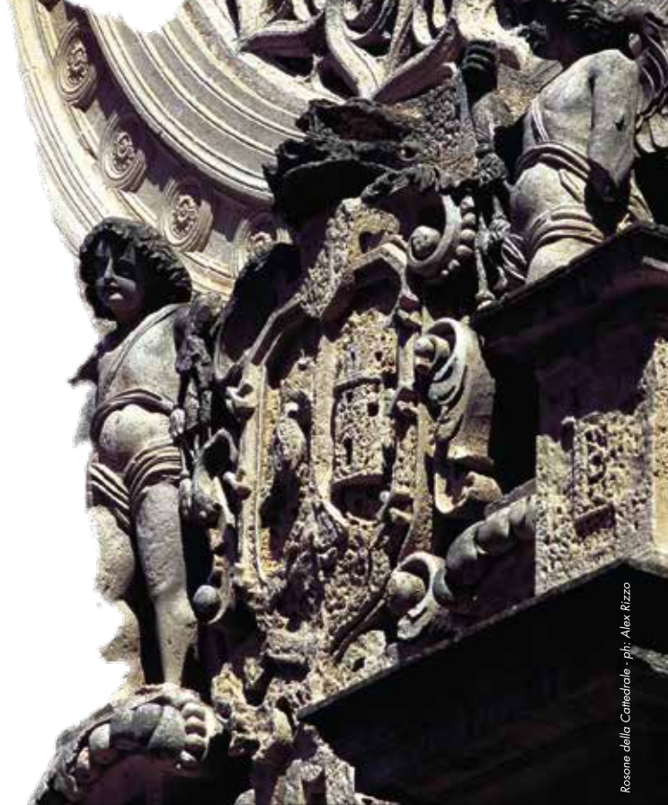
Rosone della Cattedrale