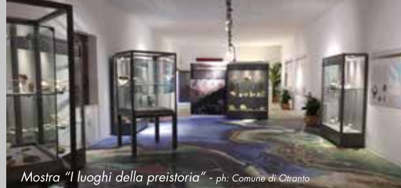
Mostra "I luoghi della preistoria" - ph: Comune di Otranto

L'edificio, contenitore culturale più importante della città, ospita mostre temporanee e la mostra permanente "Luoghi della preistoria", con valorizzazione della Grotta dei Cervi di Porto Badisco, caratterizzata dal più importante patrimonio pittorico del neolitico europeo.