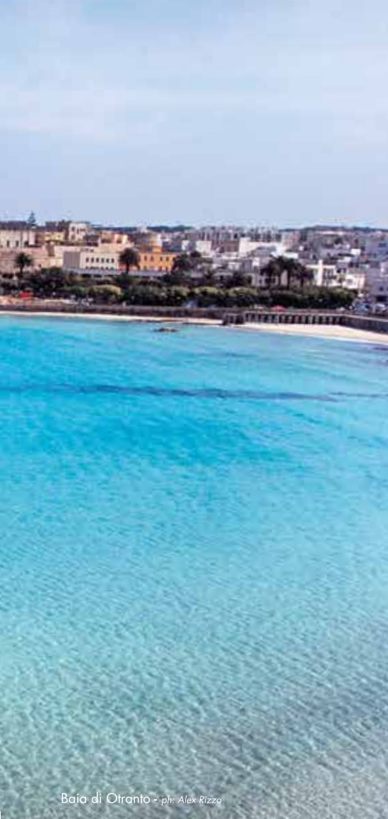
Baia di Otranto