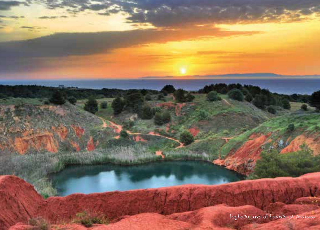
Laghetto cava di bauxite