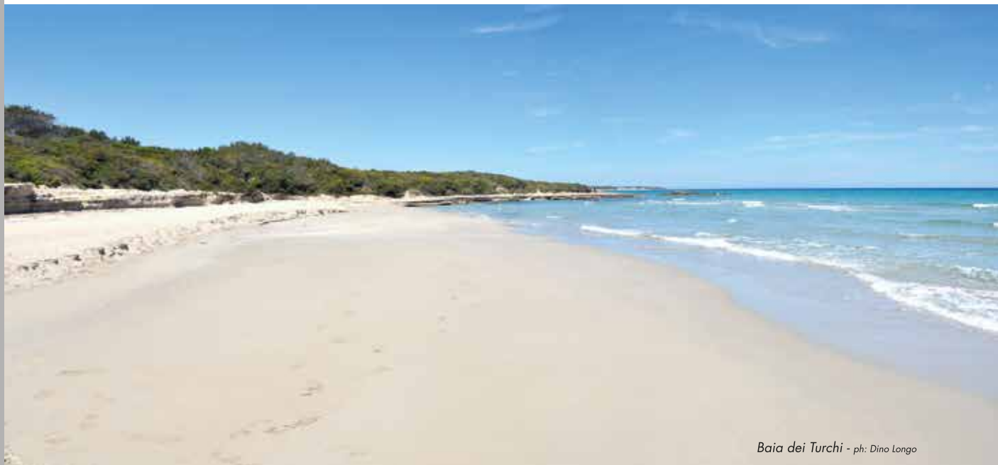
Baia dei Turchi