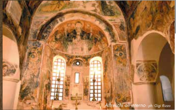
Affreschi all'interno