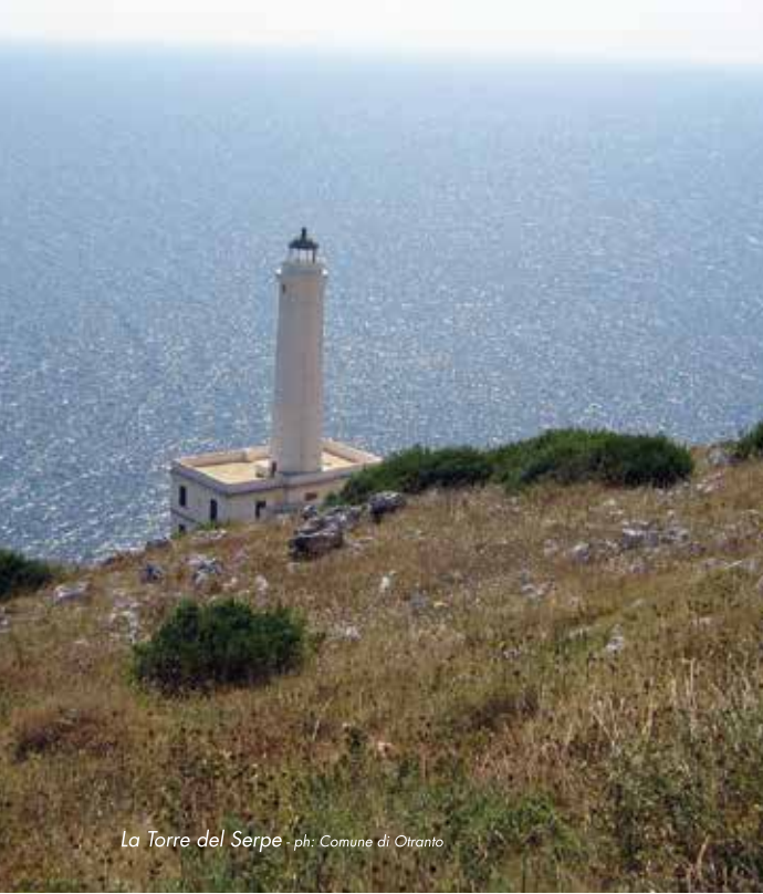
La Torre del Serpe