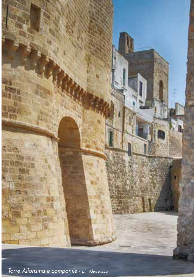
Torre Alfonsina e campanile