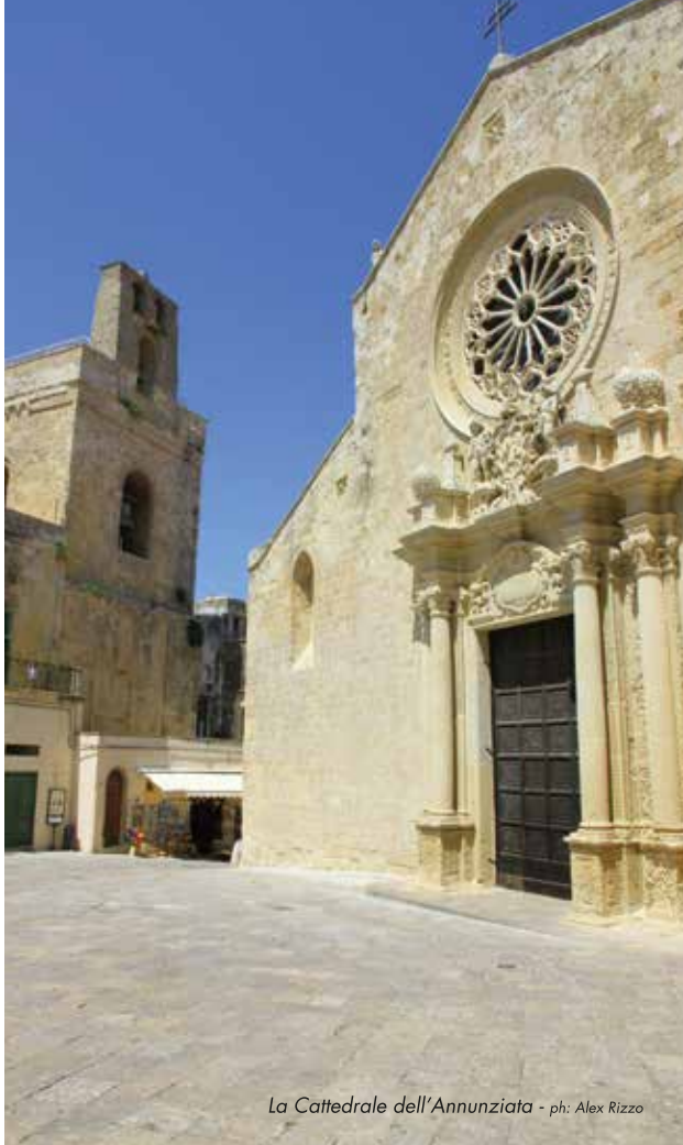
La Cattedrale dell'Annunziata