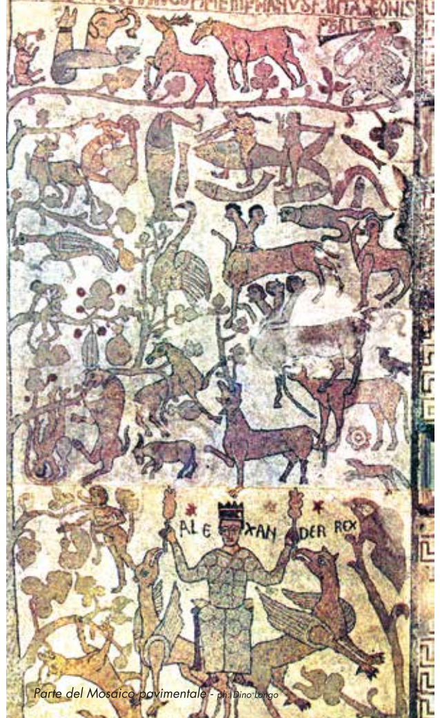
Parte del Mosaico pavimentale - ph: Dino Longo