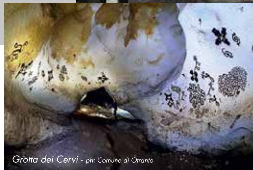
Grotta dei Cervi

The building, the most important cultural container in the city, houses temporary exhibitions and the permanent exhibition "Places of Prehistory", enhancing the Porto Badisco Deer Grotto, featuring the most important pictorial heritage of the Neolithic Europe.