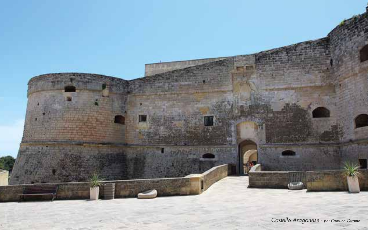
Castello Aragonese