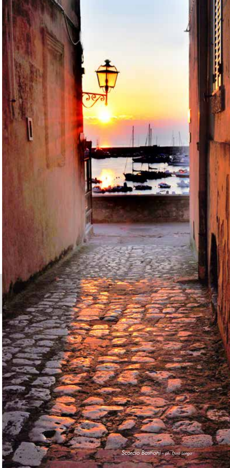
Scorcio Bastioni - ph: Dino Longo