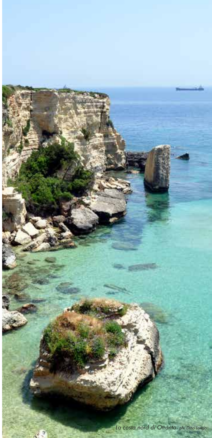
La costa nord di Otranto - ph: Dino Longo