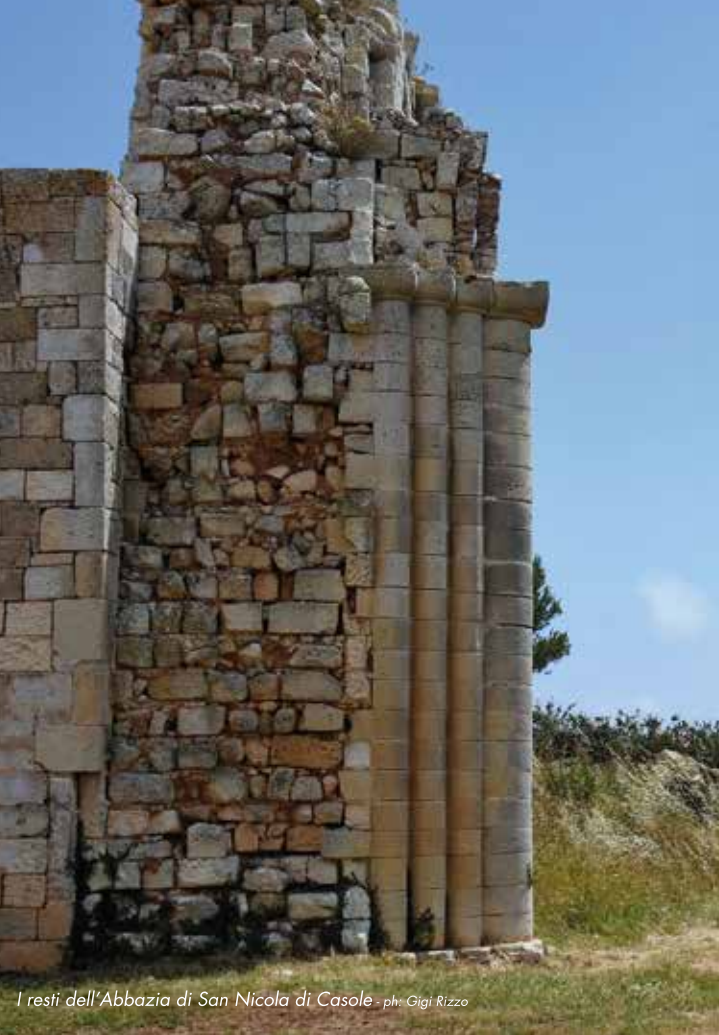
I resti dell'Abbazia di San Nicola di Casole