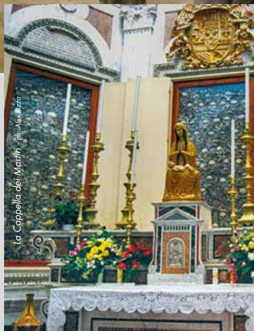
La Cappella dei Martiri - ph: Alex Rizzo

The octagonal Martyrs' chapel is located on the righthand nave of the Cathedral. Here the remains of the holy Martyrs who were canonized on 12th May 2013, are kept. In the basement there is a crypt dating back to the eleventh century with its seventy marble columns.