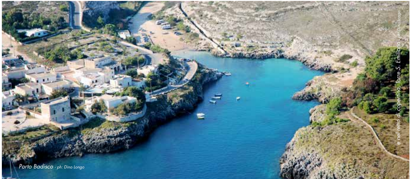
Porto Badisco